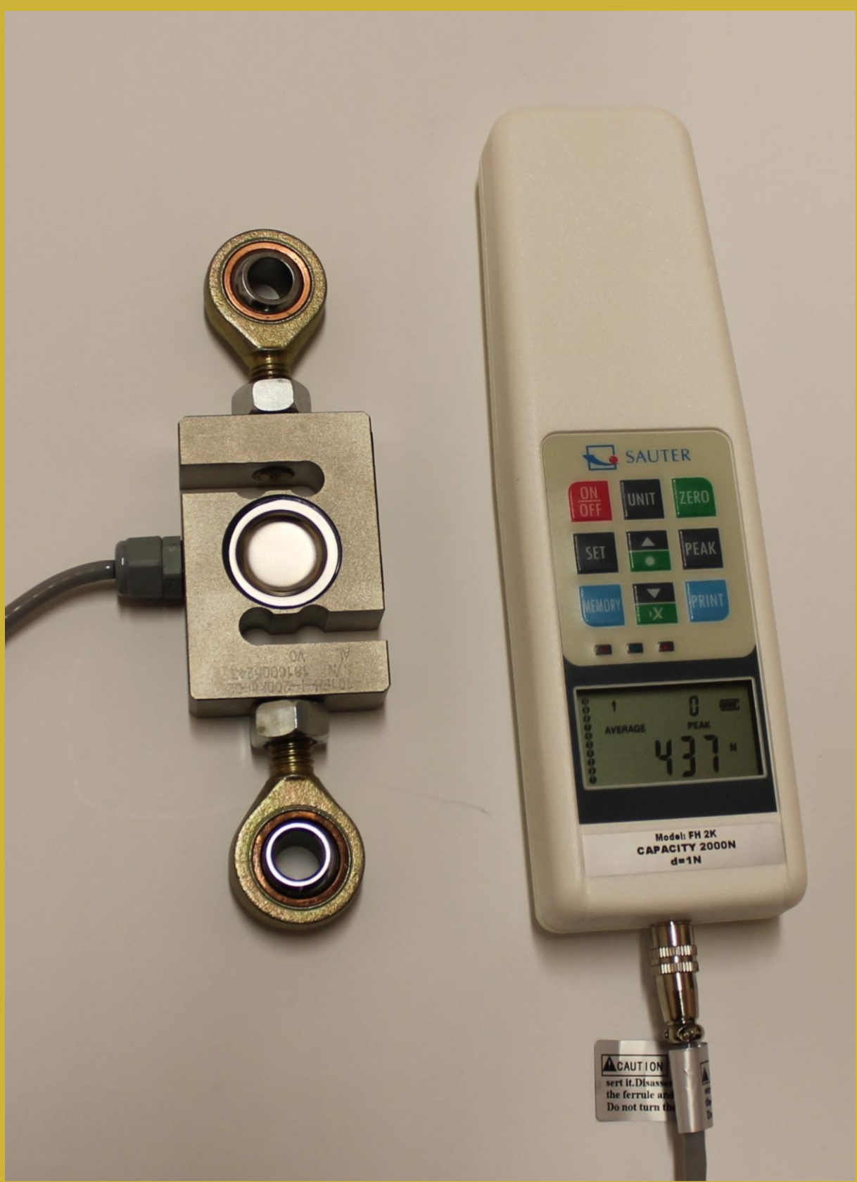
ОБЩ ВИД НА ЕЛЕМЕНТИТЕ НА ИЗМЕРВАТЕЛНАТА АПАРАТУРА – ДИГИТАЛЕН СИЛОМЕР SAUTER