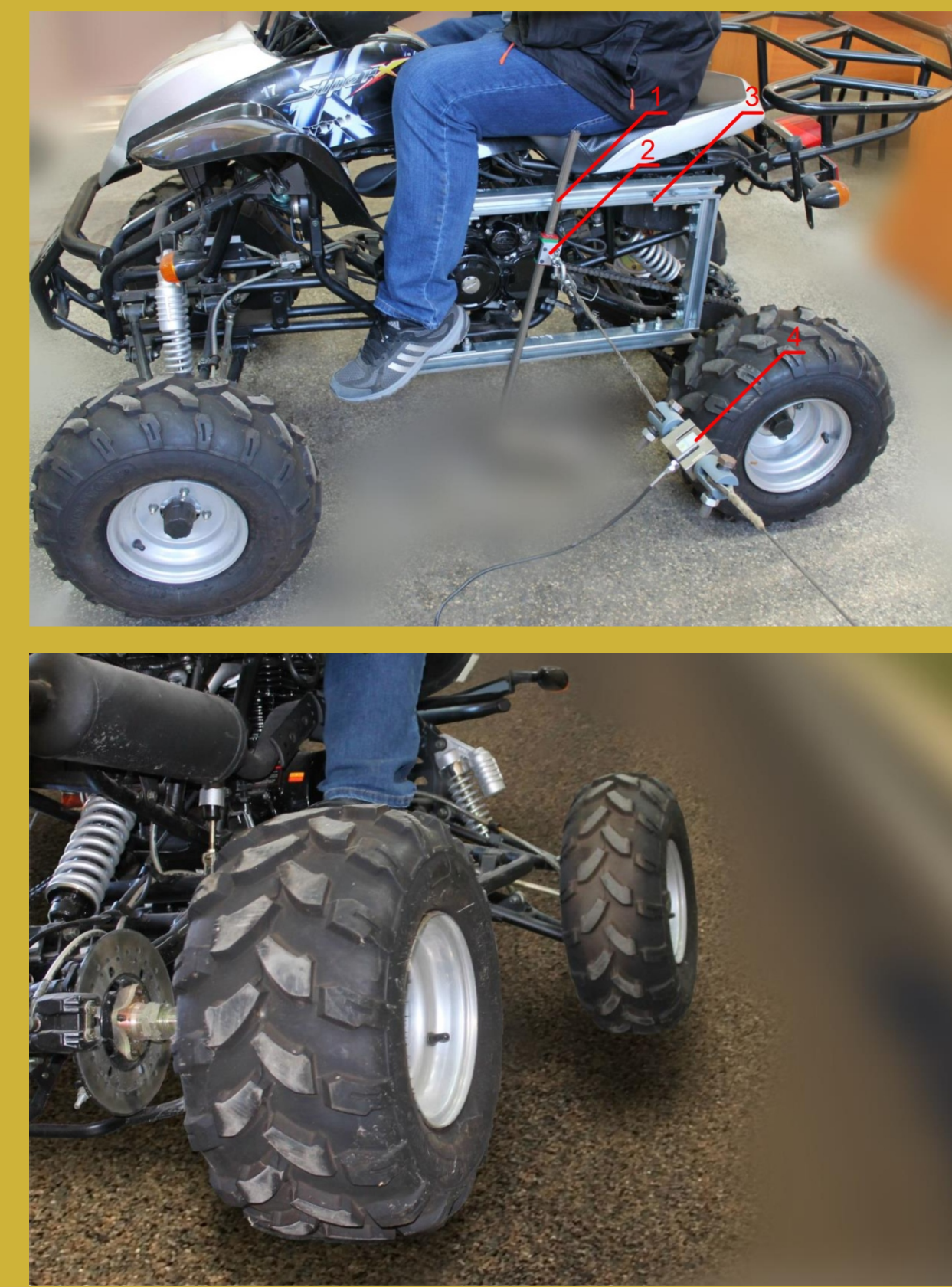
ATV ПО ВРЕМЕ НА ОПИТ ПРИ ИЗМЕРВАНЕ НА НАПРЕЧНИ СИЛИ И ПРИМЕР ЗА НАРУШАВАНЕ НА УСТОЙЧИВОСТТА НА ATV